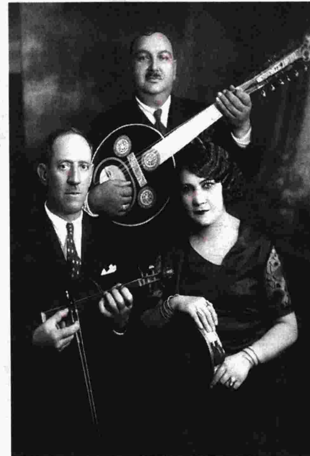
Το ντοκιμαντέρ «My Sweet Canary» του Ρόι Σερ, για τη ζωή της Ρόζας Εσκενάζυ, ανοίγει το φεστιβάλ

Στο φετινό φεστιβάλ η οικονομική κρίση έχει επιπτώσεις. «Δόγω της κρίσης, το βραβείο θα είναι τιμητικό και δεν θα συνοδεύεται από χρηματικό έπαθλο. Εδώ χρωστάμε παλιότερα βραβεία και των δύο φεστιβάλ. Ελπίζω να επανέλθουμε στην προηγούμενη κατάσταση» δήλωσε ο Δ. Εϊπίδης. Θα προβληθούν 225 ταινίες: 149 στο διε-