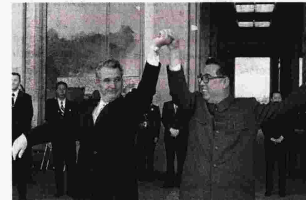
«Η αυτοβιογραφία του Νικολάε Τσαουσέσκου» του Α. Ούριτσα

θνές πρόγραμμα, 43 στο Ελληνικό Πανόραμα, 33 στα αφιερώματα και 13 στα παιδικά προγράμματα. Άλλες 13 ελληνικές ταινίες είναι διάσπαρτες στα υπόλοιπα προγράμματα, δηλαδή από τις 115 που υποβλήθηκαν, θα